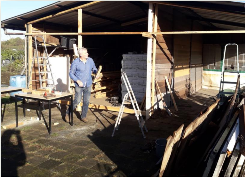
Foto: voor en na de werkzaamheden.

In de vorige winter hebben ze een hele nieuwe zijwand getimmerd. Op dit moment zijn ze de achterwand aan het dicht maken, zodat deze ruimte achter de kantine nog meer gebruikt kan worden voor opslag van goederen en dergelijke.